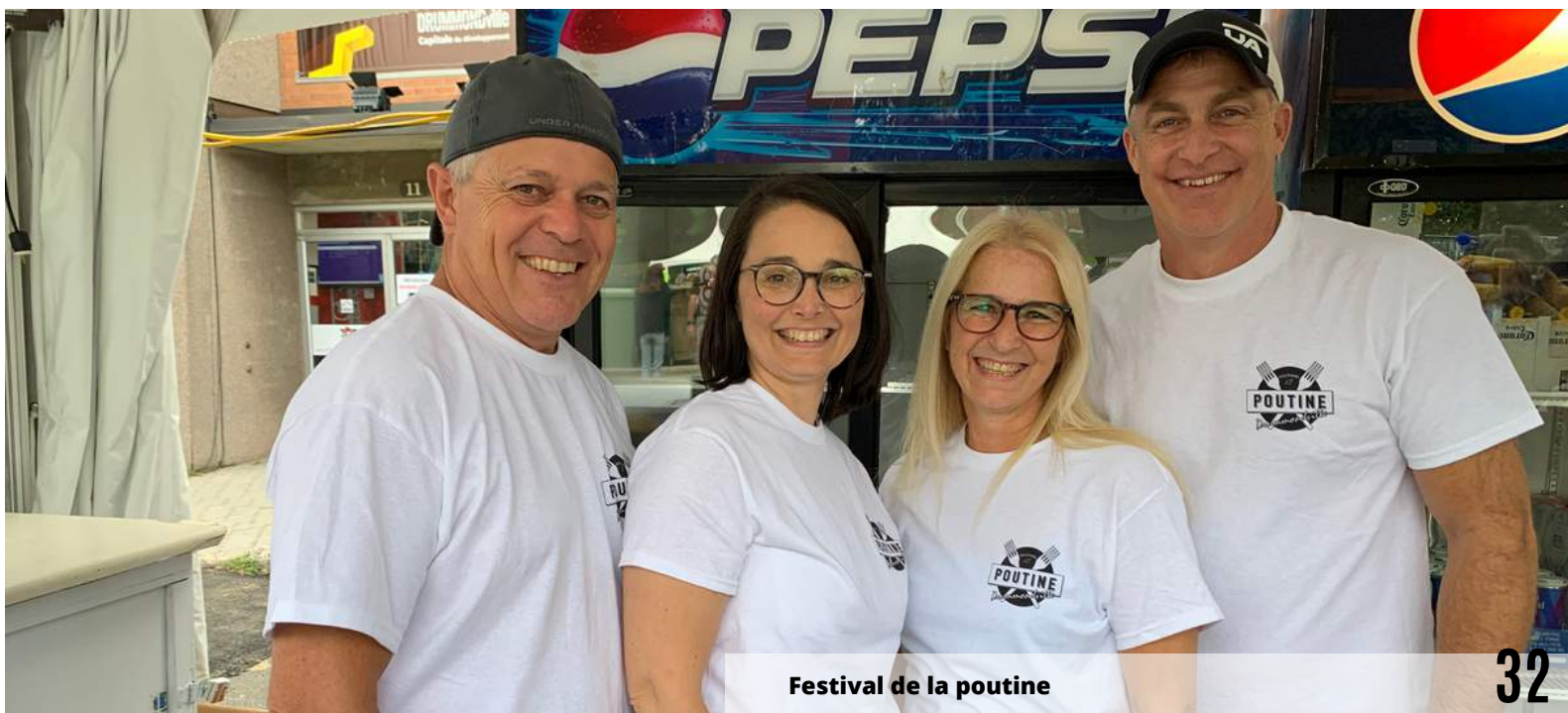
Festival de la poutine