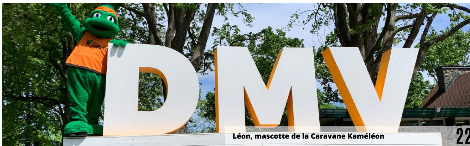
Léon, mascotte de la Caravane Kaméléon