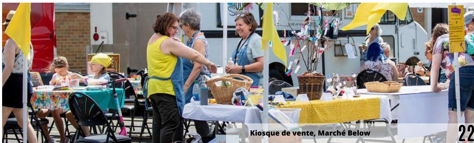
Kiosque de vente, Marché Below

Les bénévoles présents à la table de vente ont mentionné avoir renforcé des liens, passé un beau moment et éprouvé le sentiment de faire partie de la communauté. L'argent amassé servira à acheter du matériel pour la Ruche.