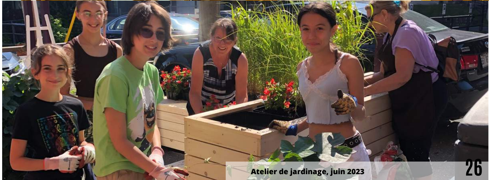
Atelier de jardinage, juin 2023